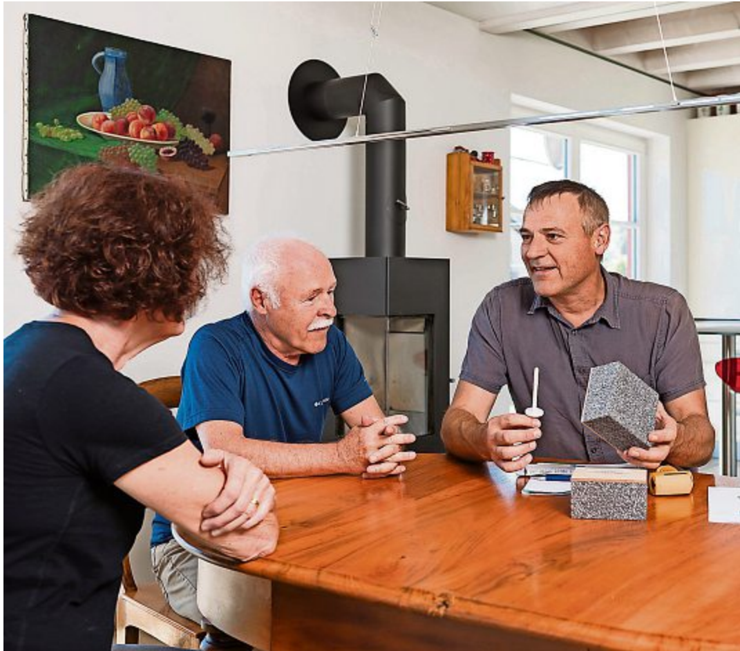
onyx steht bei Energie-Fragen gerne beratend zur Seite.