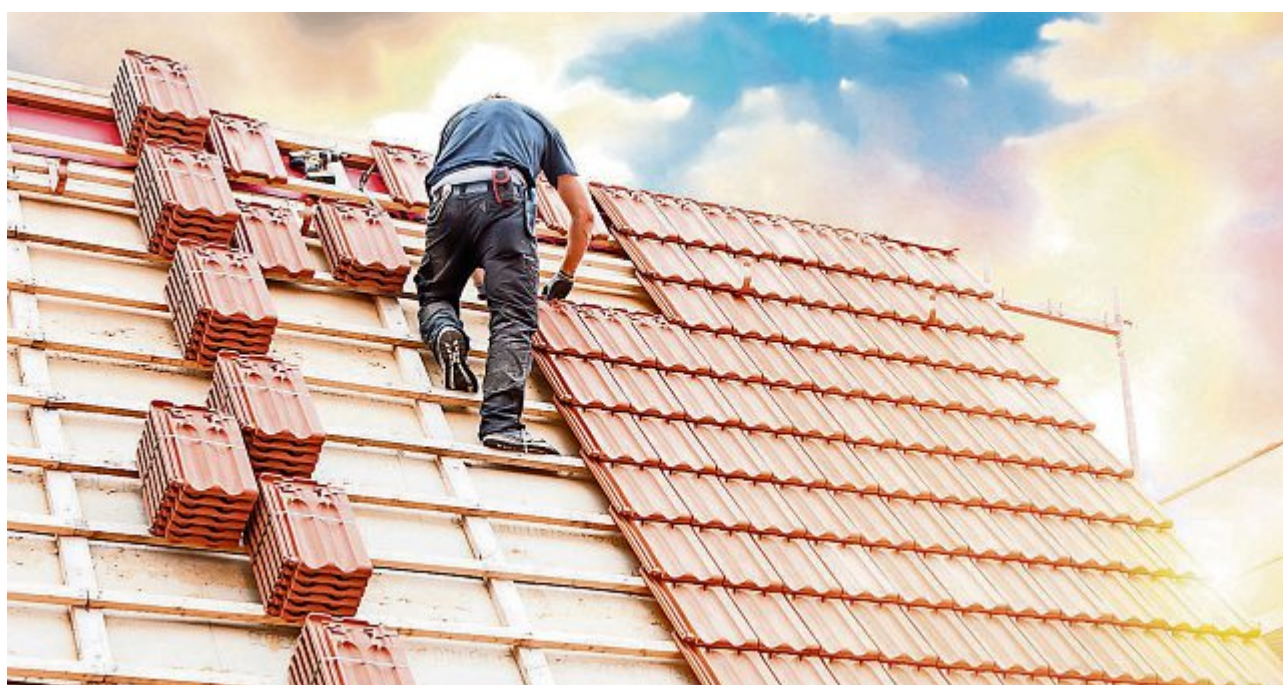
Ein Dachdecker bei der Arbeit.