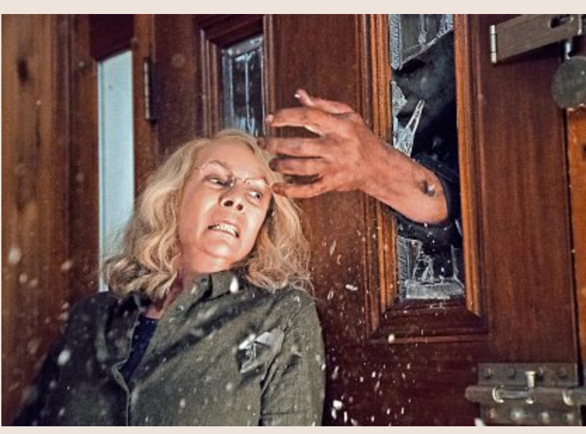
Der mordlüsterne Michael Myers ist zurück und versetzt die Einwohner von Haddonfield erneut in Angst und Schrecken. © Universal Pictures