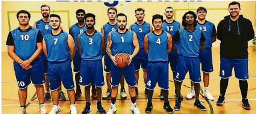
Die 49ers starten voller Elan in ihre erste Saison.

Körbe wie in der NBA | Fortsetzung von Seite 1