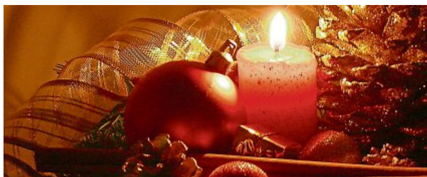
Am letzten Novemberwochenende gibt es in Wangenried Weihnachtsgeflüster.

Wangenried 23 Aussteller bieten am Weihnachtsgeflüstermarkt in Wangenried ein breites Angebot an kreativen und mit viel Liebe erarbeiteten Werkstücken an. Winterliche Getränke werden im Chalet vor dem Stall angeboten. Zu probieren