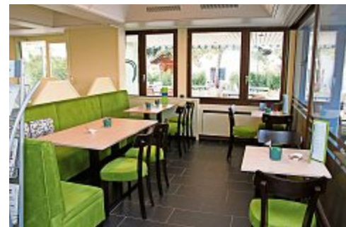
Das gemütliche Bistro lädt zum «Käfele».