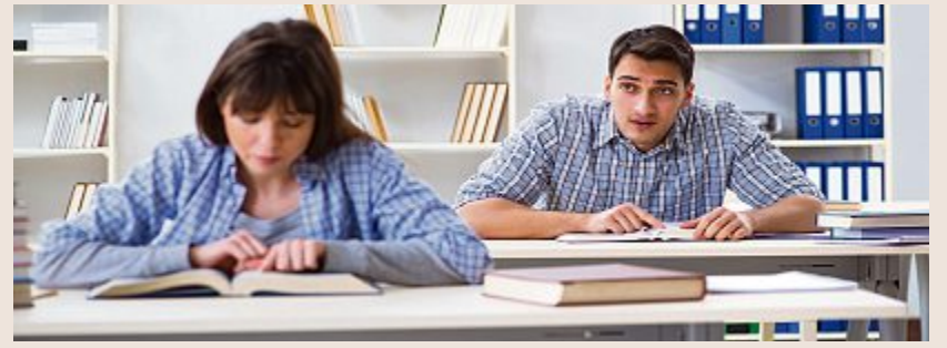
Übergriffe brauchen keinen Körperkontakt.

Liebe Erika Die Aussagen des Lehrers gehören eindeutig in die Kategorie des sexuellen Übergriffs. Dafür braucht es keinen Körperkontakt, auch ein