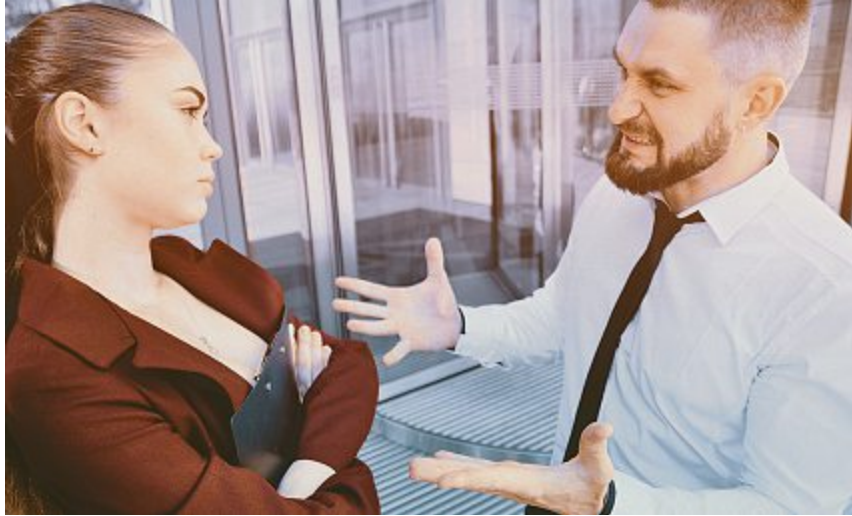
Bei arbeitsrechtlichen Problemen ist die direkte Konfliktlösung in aller Regel besser als der Weg vor das Arbeitsgericht.