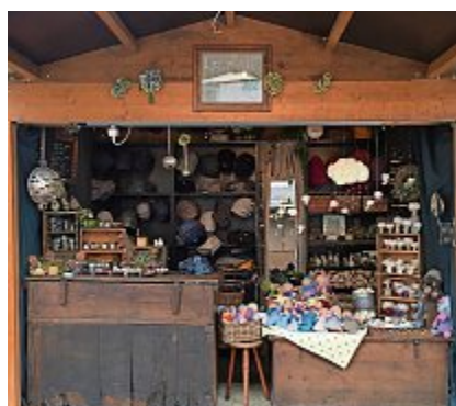
Im Herbst und Winter ist es Marktzeit. In nächster Zeit ist Esther Wyss an diversen Märkten anzutreffen.

Chlausemärit Solothurn; 5. + 6. Dezember, 12.00 - 21.00 Uhr.