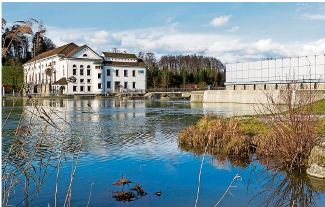
Energieeffiziente Gebäude können sich auch optisch sehen lassen

Weitere Informationen sind unter www.onyx.ch oder 058 477 21 21 jederzeit verfügbar. pd