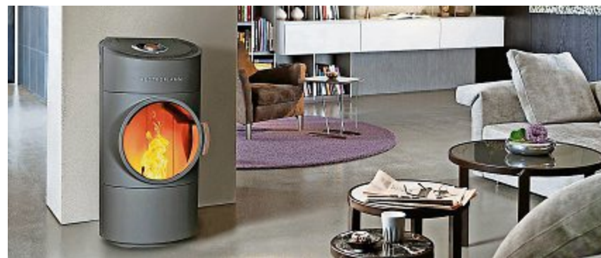
Macht im Wohnzimmer eine gute Falle: der Clou compact Pellet. z.Vg.

Wer sich über die Produkte der Firma Greub informieren möchte, ist jeweils am Freitag von 14 bis 17.30 Uhr, am Samstag von 9 bis 11.30 Uhr oder auf Anfrage jederzeit im Showroom willkommen. Am Freitag 26. Oktober von 14 bis 21 Uhr und am Samstag 27. Oktober, von 9 bis 18 Uhr findet zudem die Herbstausstellung an der Langenthalstrasse 84 in Lotzwil statt. pd