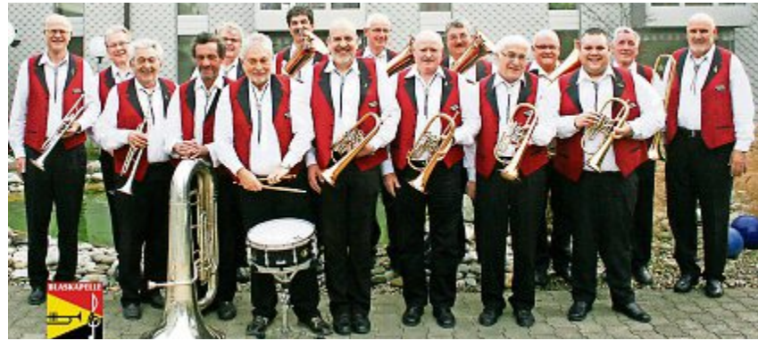
Die Blaskapelle Oberaargau freut sich auf das Jubiläumskonzert.

Training ab 20. Oktober 2018 bis 25. Mai 2019, jeweils am Freitag von 18.30 bis 20.00 Uhr in der Sporthalle Hard in Langenthal. www.49-lthal.ch info@49-lthal.ch / 079 446 45 60