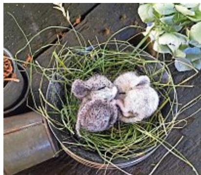
... und Mäuschen aus Wolle.