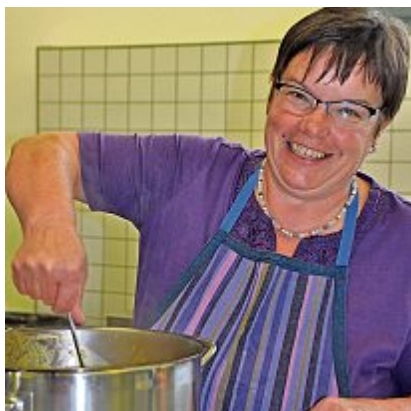
Auf die Besucher des Herbstfestes wartet eine hausgemachte Kürbissuppe z.Vg.

Murgenthal An Marktständen wird Selbstgemachtes, wie eingemachte Lebensmittel, Bauernbrote sowie Deko- und Bastelsachen verkauft. Dieses Jahr findet ebenfalls der Koferrmarkt für angemeldete Kinder und Jugendliche statt. Die Kindergarten- und Schulklassen von ganz