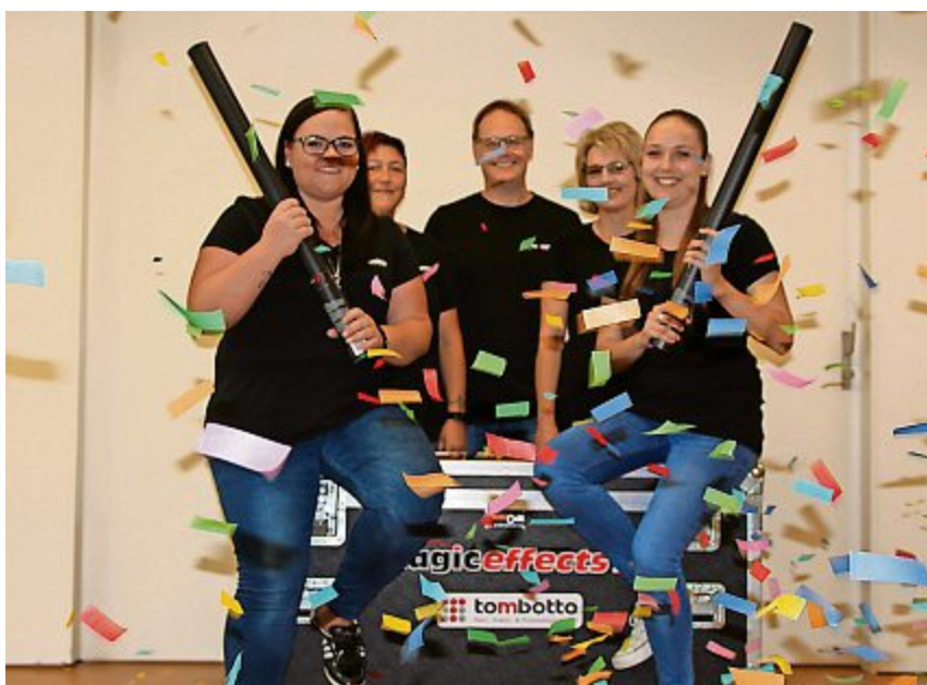
Auch handliche Party-Shooter und Konfetti-Kanonen gibt's bei tombotto. bt

Im Sortiment des Familienunternehmens aus Aarwangen finden Sie alles aus einer Hand, was es braucht, um ein gelungenes Fest oder einen professionellen Grossanlass durchzuführen: Lose, Glücksräder, Gutscheine & Bons, Einweggeschirr, Kartendruck, Eintrittskontrolle, Ausweishüllen, Lanyards und mehr. Den Ideen sind beinahe keine Grenzen